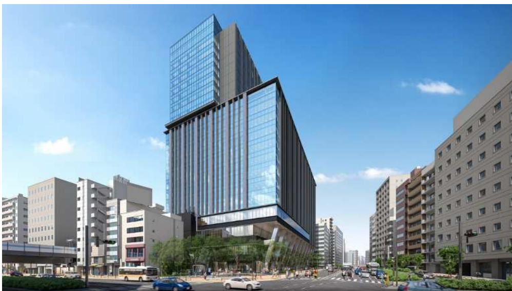
外 観（イメージパース）

「 TOKYO, NEXT CREATION 」をコンセプトに、多様な出会いと交流、新しい価値創造を促す次世代の街の拠点を目指します。