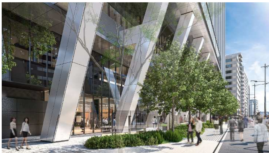
フロントテラス（中原街道沿い）