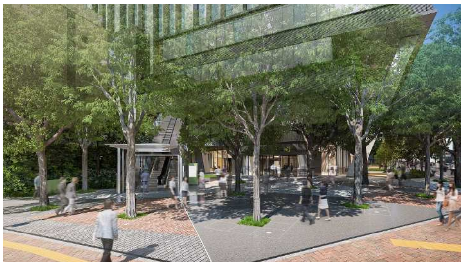
メインエントランス（五反田の森）