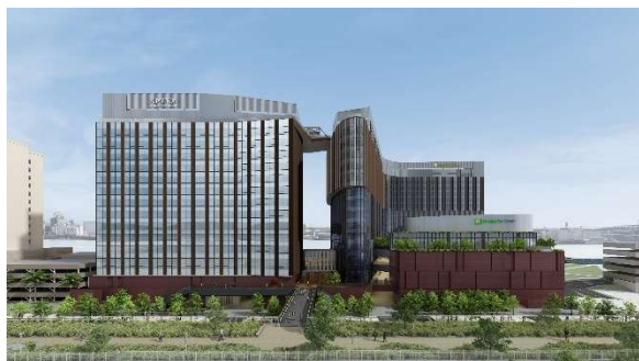
ユニバーサル・スタジオ・ジャパン側 外観パース

西側は、ブルックリンの街並を想起させる重厚感のあるイメージとし、東側は、安治川の煌めく水面を映し出す、開放的で透明感のある佇まいとしています。都市と自然が交差する風景の中に調和を描き出し、この土地ならではの体験価値を提供するディステーション(旅の目的地)を目指しています。