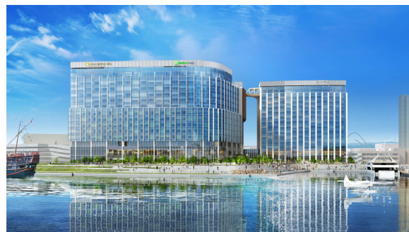
安治川側 外観パース