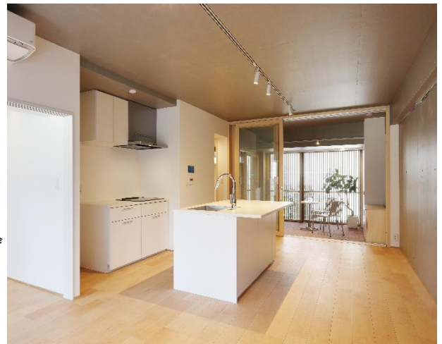
BreezyTerrace (3階 Et タイプ)