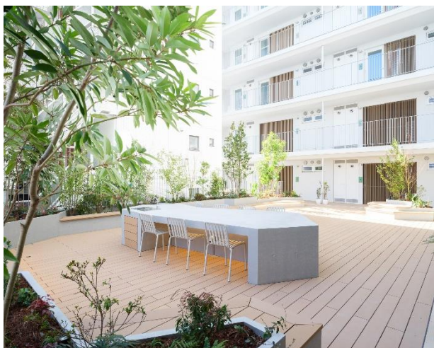
ガーデンテラス (2階)

敷地内北側には、道路から自由に入出入り可能な広場を設置し、周辺の街並みに緑と潤いを提供する空間を設けました。広場内にはベンチを設置し、季節を感じられる草木に囲まれ、心豊かな時間をお過ごしいただけます。