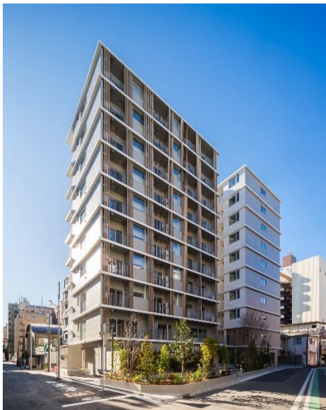
外観（敷地北側から）

また、脱炭素社会の実現に向けた取り組みとして、ZEH-M Oriented の認証を取得したほか、一部の共用部使用のため、太陽光発電設備利用や雨水の中水利用等、地球環境にも配慮した建物となっております。