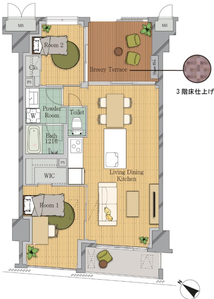
平面プラン (2階 Et タイプ)

ホワイトを基調とした爽やかな内装仕上げに、天井・壁をコンクリート打放し仕上げや天然木の建具・フローリング等を採用し、自然素材の質感をアクセントとしています。また、バルコニー側・共用廊下側の両面から採光が確保できるよう、玄関にはガラス扉を採用しています。