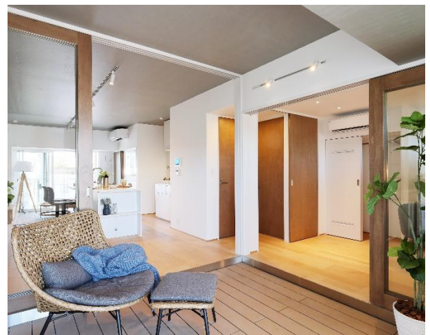
InnerTerrace (10階 E タイプ)