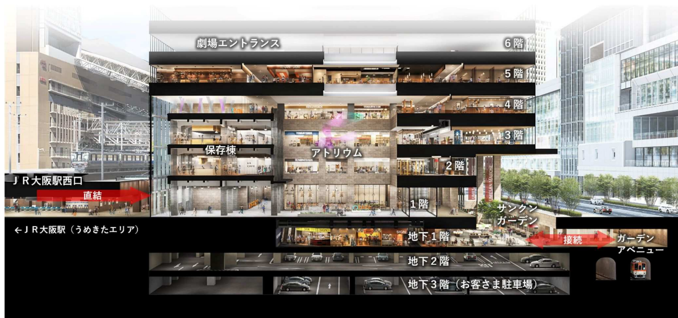
「KITTE大阪」フロア構成イメージ

「KITTE大阪」は、まだ知らない、まだ体験したことのない日本各地の魅力的なヒト・モノ・コトを集め、日本の良さを再認識し、発見できる場所を目指したいとの思いから、「UNKNOWN（アンノウン）」をコンセプトとして、地下1階～6階までの商業フロアを展開します。各フロアには「日本各地の UNKNOWN」を集め、知って、試して、味わって、過ごして、といったさまざまな体験を提供し、知的好奇心を刺激し、ワクワクできる施設を目指します。