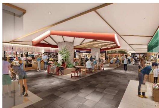
2階 日本のファンづくりフロアイメージ