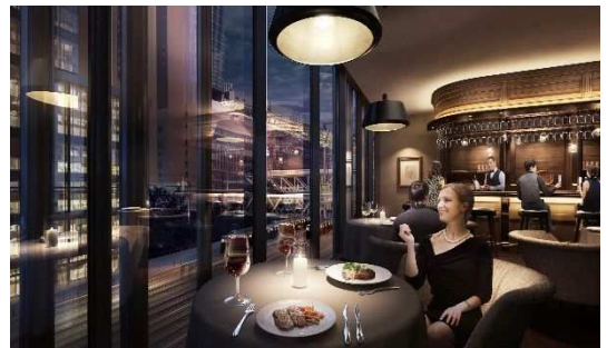
5階 日本を代表するレストランフロアイメージ

「日本のおもてなし」をテーマに、落ち着いて食事のできる空間を提供するフロアです。居心地の良いレストランが集まり、接待や会食、記念日、ハレの日などの特別なシーンにも利用できます。大阪初進出の名店や日本初の店舗などが軒を連ね、丹精込められたお料理とおもてなしで特別な時間をお過ごしいただけます。