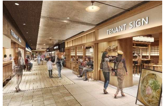
4階 わが街自慢の人気レストランフロアイメージ

大阪では誰もが知るような繁盛店や、日本各地から大阪に初進出する人気店が集まったフロアです。大阪の新たな玄関口となる「KITTE大阪」に、和食、イタリアン、フレンチなどバリエーション豊かで地域色と活気があふれるレストランが集結します。