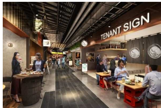
地下1階 「うめよこ」イメージ