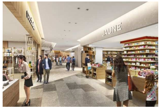
3階 地域の銘品フロアイメージ

日々の暮らしにまつわる「MADE IN JAPAN」の商品をお楽しみいただけるフロアです。日本の古き良きものから、現代になって新しく生まれたものまで、日本の各地域で作られた、暮らしをちょっと贅沢にしてくれるこだわりのアイテムを取り扱います。