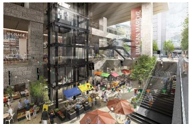
「サンクンガーデン」イメージ

今後とも各種プロジェクトや施策を推進し、大阪駅周辺の発展と賑わいの創出、地域の価値向上に貢献してまいります。