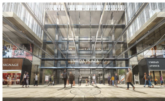
1階 北側エントランスイメージ

また、四つ橋筋に面して西梅田の顔となる店舗が並ぶほか、JR高架沿いの北側通路には通るたびに立ち寄りたくなるような店舗を並べ、新しい街並みを形成します。