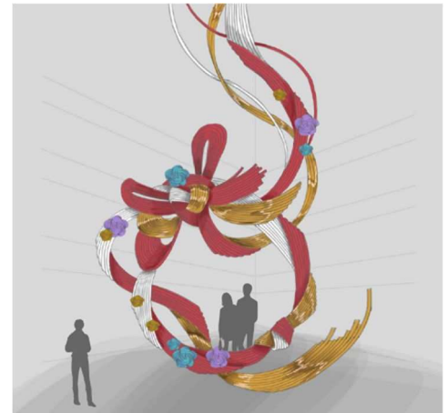
モニュメントイメージ

今後、公式 SNS アカウント（Instagram / X）や特設 WEB サイトにおいて、ワークショップの開催案内や制作過程などを順次公開予定です。完成したモニュメントは「KITTE大阪」の顔となる1階アトリウムに設置予定であり、2024年7月予定のグランドオープン時にお披露目します。