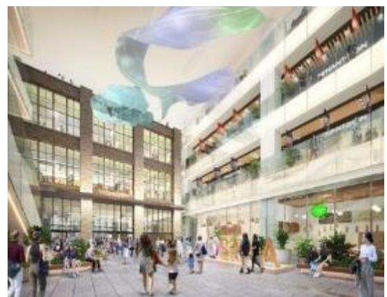
商業施設アトリウムイメージ