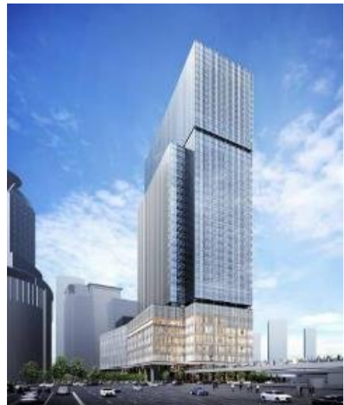
建物外観イメージ