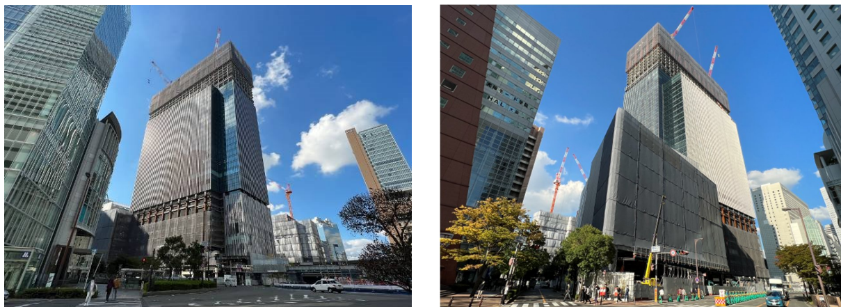
建設工事の様子（左：JR大阪駅前南側から、右：本計画地南西側から）2022年11月2日時点

地上の鉄骨工事が完了し、本日上棟しました。2024年の建物竣工を目指し、工事は順調に進んでいます。