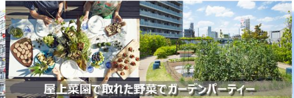
屋上菜園で取れた野菜でガーデンパーティー