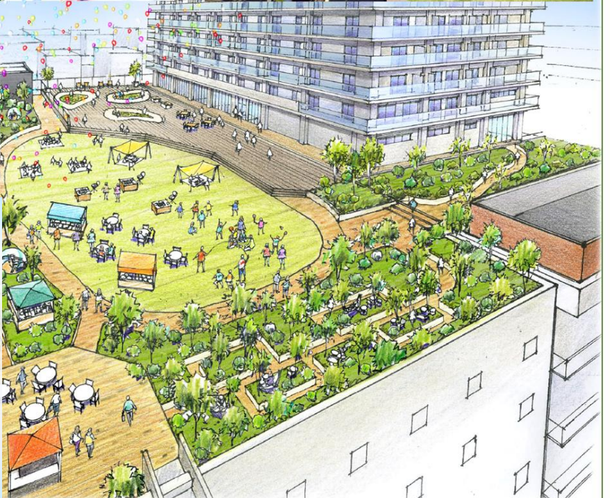
街の交流拠点として