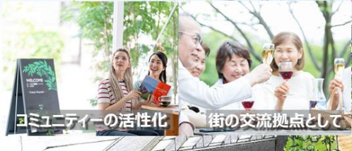
コミュニティーの活性化