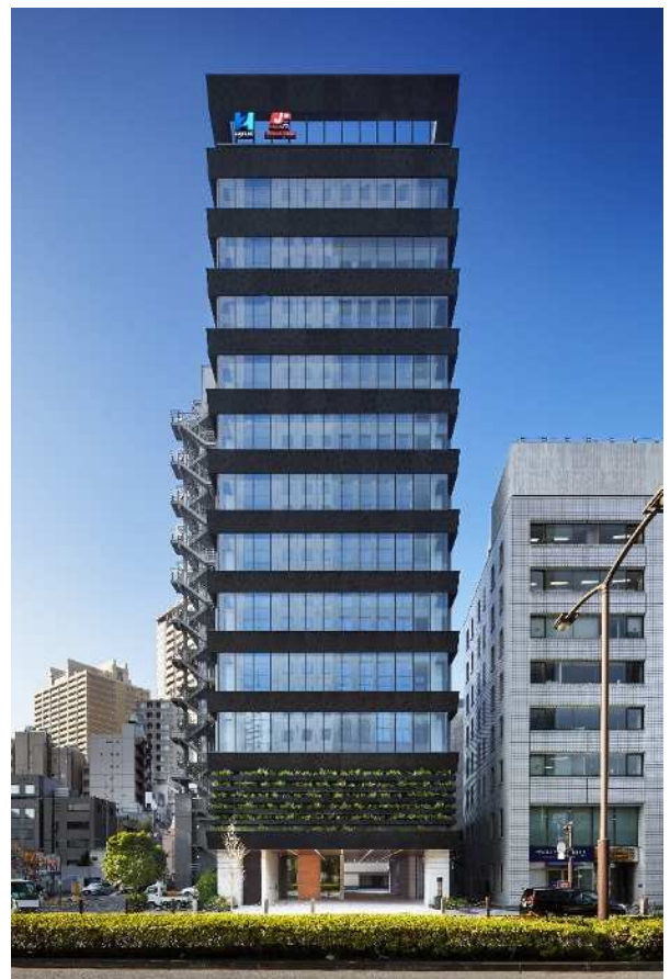
外堀通り側ファサード