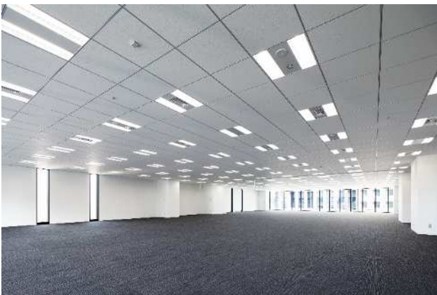
基準階オフィススペース