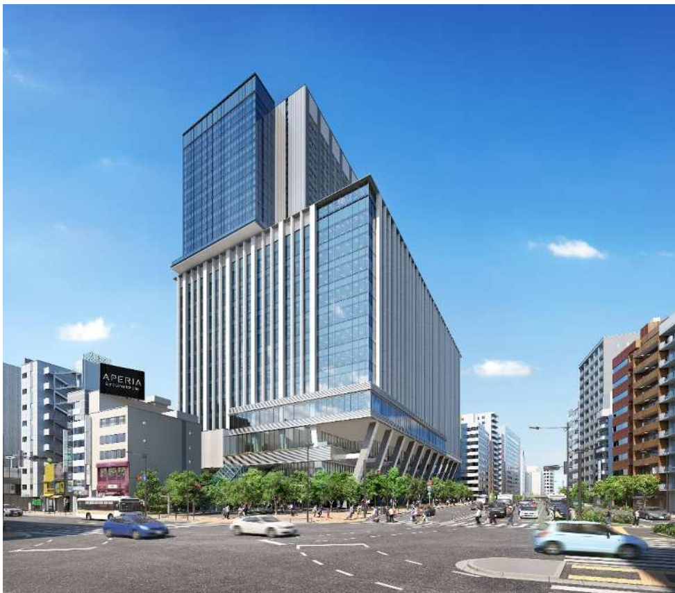
※建物全体の外観イメージ